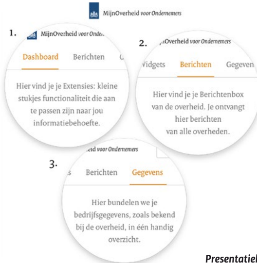
Presentatielaag MijnOverheid voor Ondernemers